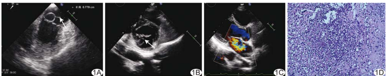
图 1 二尖瓣后叶瘤合并感染性心内膜炎并穿孔 A. 抗感染治疗前超声心动图(箭示混合条索样附加回声); B、C. 抗感染治疗后超声心动图(B, 箭示连续性中断)和 CDFI(C, 箭示二尖瓣中等量反流); D. 病理图(HE, ×100)

[中图分类号] R542.5; R540.4 [文献标识码] B [文章编号] 1003-3289(2022)07-1069-01