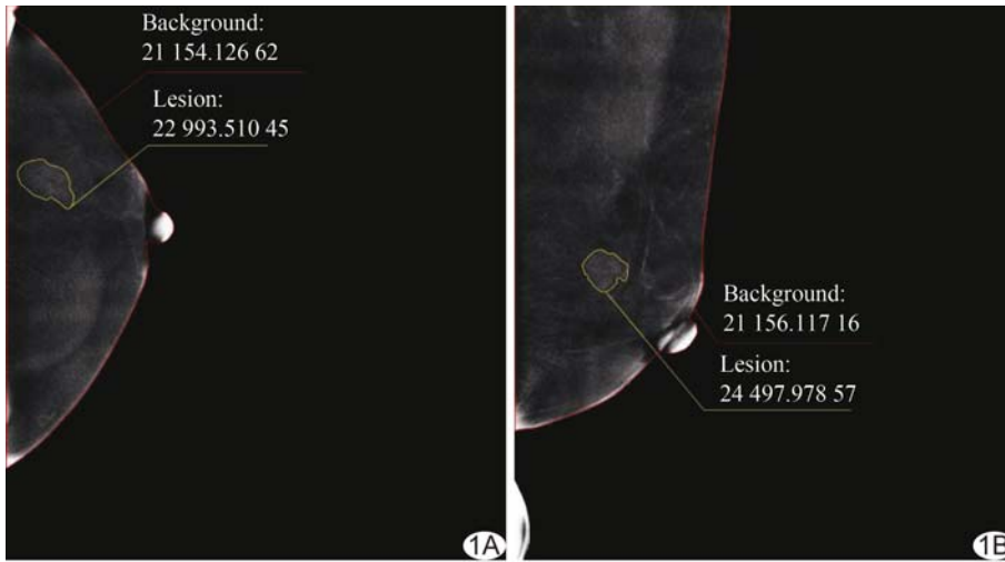
图 1 于 T1 期患侧 CC 位(A)及 T2 期患侧首次 MLO 位(B)CESM 减影图上勾画病灶 ROI(白线区域)示意图 红线区域为背景区域

皱等,得到 BPE 的 ROI,对 MLO 位 BPE 的 ROI 还应减去胸大肌范围,分别测量 T1、T2、T3 期 LGV 及 BPE;采用公式 1~3 计算病灶与背景灰度值比值(the lesion to background grey value ratio, LBR)、相邻 2 个时相病灶灰度值差(lesion grey value difference, LGVD)及 LBR 变化率。